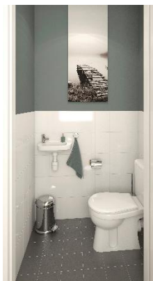
Impressie toilet appartement 1 en 2