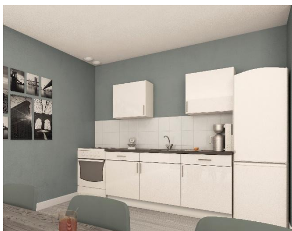
Impressie appartement 1 en 2