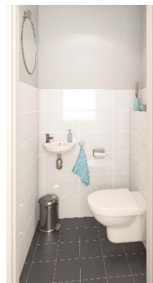
Impressie toilet appartement 3 t/m 14